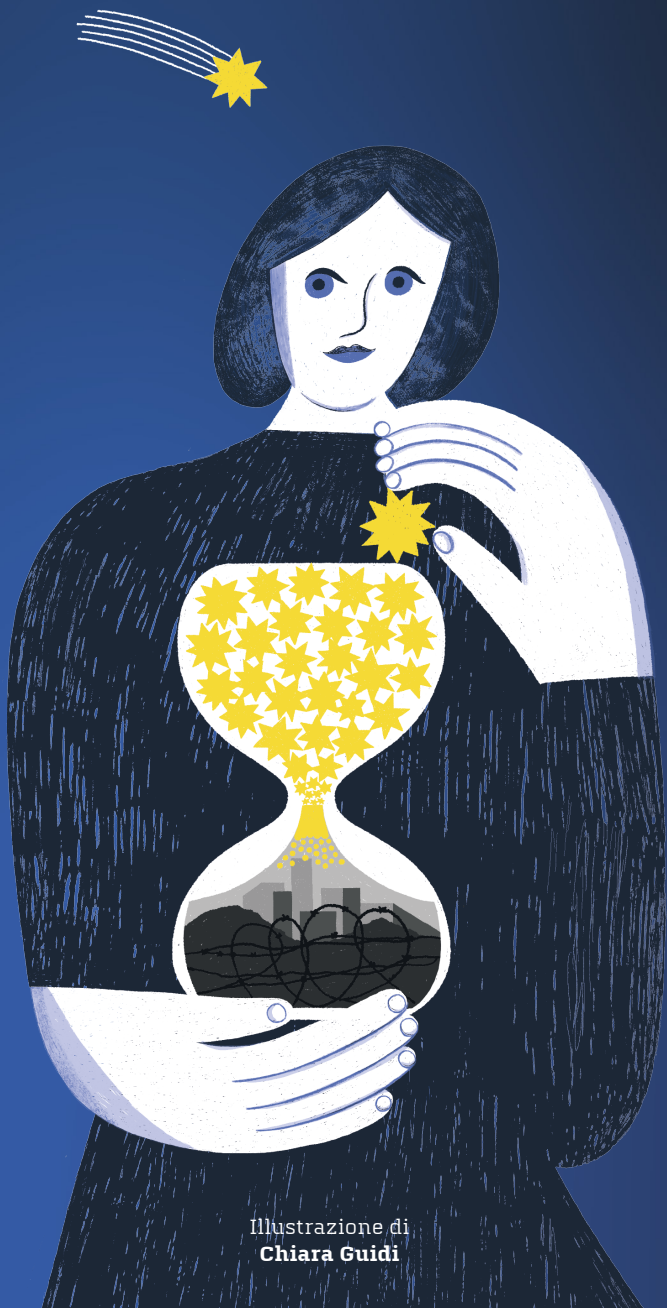
Illustrazione di Chiara Guidi